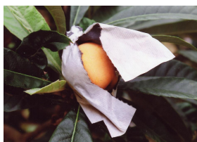
強い抗酸化力を持つ びわ種・びわ葉