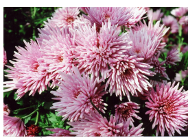
高ポリフェノール含有 もってのほか(食用菊)