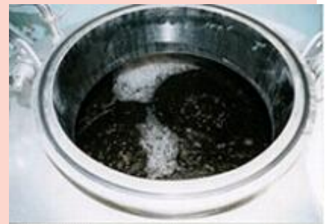
発酵途中の「バランス」 まだ、濁って強い匂いを発している

これらの強力な抗酸化力を持つ天然素材を化学的な抽出法ではなく、有用微生物群（EM）によって長期発酵・熟成するという自然な方法で抽出することにしました。群というだけあって当然ながらひとつの菌ではなく、乳酸菌、酵母菌、放線菌、糸状菌、光合成細菌など、なんと80種類以上の微生物を組み合わせたものです。