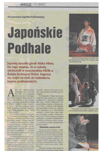
桜祭りを報じたポーランド の新聞記事