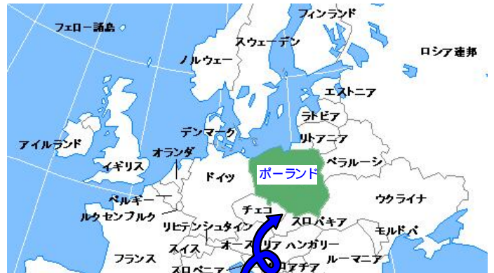
ポーランド・ハルクロヴァ村

・・・今、数千キロを隔てた地で、そんな熱い夢を語り 合っています。(インターネットって本当にありがたい)