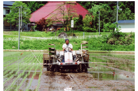
田植えに精を出す