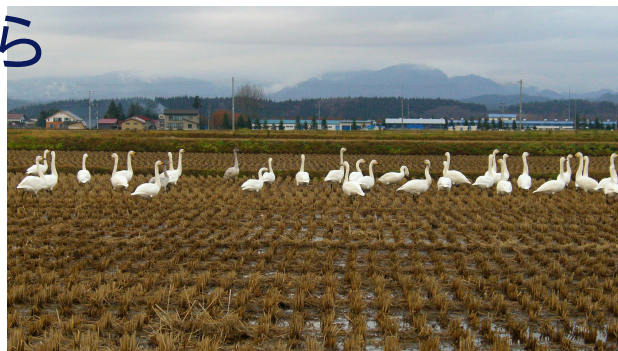
町内の遊水地で越冬する白鳥。刈入れの終わった田んぼは、最高の餌場になります。

石貝はタナゴやコイと共生する二枚貝。この貝がいることで、コイ科の魚が生息していることがわかります。