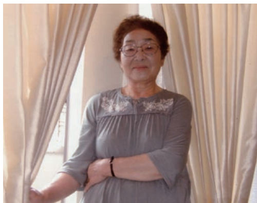
昭和 7 年生まれ、現在 76 歳