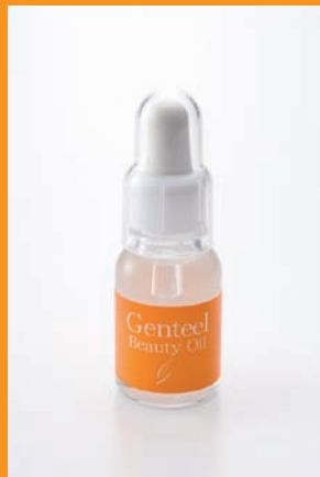
『ジェンティール』 『ビューティーオイル』 20mL 5000円(税込)

◆100%植物ピュアオイルですので8℃以下で凝固する性質を持っております。通年を通して、できるだけ10℃以上の場所で保管いただきますようお願いいたします。なお、凝固・溶解を繰り返しても商品の変質は起こらず品質に全く問題はありませので、安心してお使い下さい。 ◆『ビューティーオイル』の無料サンプルについて・・・ オイルが漏れるなど、容器の問題がありご用意させていただいておりません。大変申し訳ございません。