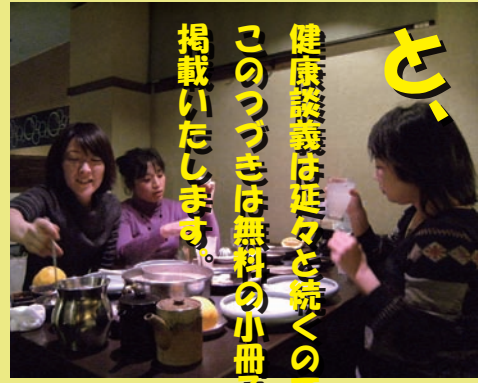
健康叢書は延々と続くのですが、このつづきは無料の小冊子にて掲載いたします。

B美さん ：C代の場合、そんなことを考えるより、とにかく食べる量を減らすほうが先よ！