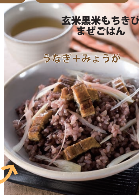
玄米黒米もちきび まぜごはん

●できればそのまま、何もかけずに炊きたてを召 し上がってみてください。食感がとてもなめらか になっています。モチキビが適度に混ざり合っ て、玄米の口当たりをととても柔らかくしてくれ ます。