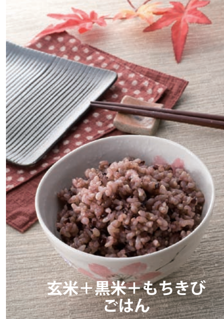
玄米+黒米+もちきび ごはん

でも、ちょっと食べにくい、ぼそぼそ してにがて、と言う方もいますし、玄米 の香りがいや、と言う方も多いですね。 そこで今回は、“ぼそぼそ感をなくし、 玄米特有の香りを抑える炊き方”のご紹 介です。