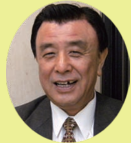
NT様 (東京都 損保代理店経営)