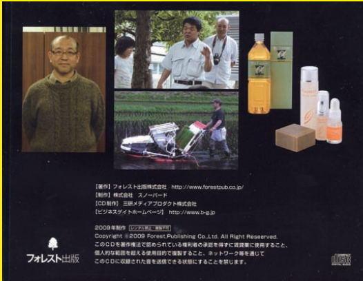
【発行】フォレスト出版株式会社 http://www.forestpub.co.jp/ 【制作】株式会社 スノーボード 【CD制作】 三好メディアプロダクト株式会社 (ビジネスサイトホームページ) http://www.b-b.jp ©2009年制作 (CD/DVD) 三好メディアプロダクト株式会社 Copyright ©2009 Forest Publishing Co., Ltd. All Right Reserved. このCD/DVDを複製または転載して、無断で第三者に複製または転載することを、 個人的な範囲を超えて使用目的で複製すること、ネットワーク等を介して このCD/DVDに収録された音声を送信できる状態にすることを禁じます。

★実は、昨年『高橋剛商会』は出版社の取材を受けました。★東京都中野区の小学校で 田植えを行い、食育の授業風景が日本農業新聞に掲載されました。