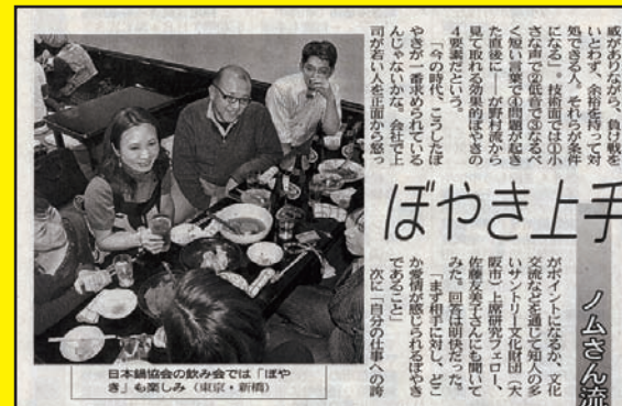
日本鍋協会の飲み会では「ぼやき上手」も楽しみ（東京・新宿）

メンバーの方々からは『芋の子鍋はダントツに美味しい！』とお墨付きをもらいました。