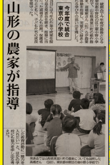
山形県今年度最後となる 山形県中野区立中野小学校 で行った山形県産米の食育 体験授業の様子。(左)山形県 産米の食育体験授業の様子 を撮影した。