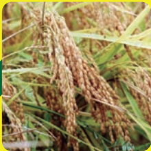
米ぬか発酵エキス