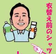
衣替え前のシャツ