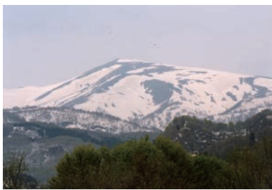
真室川町から望む霊峰・月山

と、そりゃあ心細くなる、情けないほど自分が弱く感じられる、そして同じ歳回りで、やっぱり同じようにガンで死んだ親父や二人の兄貴のことが浮かんできて、俺ももうだめなのかって思ったもんだ。 それが『あの水』で生かされて、今日まで来た。あれからもう8年だ。 まあこうなると、俺にとつて『あの水』はお守りのようなもんだな。 病気になるた時の心の辛さを知ってるから、『安心』のありがたさも身に染みるんだと思う。 そう『あの水』は心のお守りでもあるってわけだな。